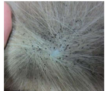
Œufs de puces

Vous pouvez éviter cela en traitant régulièrement votre furet (tous les mois si l'animal sort ou est fréquemment en contact avec d'autres animaux) avec des produits anti-parasitaires