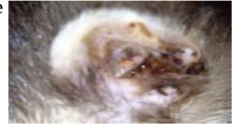
Oreille de furet

toyage régulier évite l'apparition de la gale.